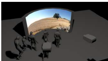
Installazione immersiva cilindrica parziale